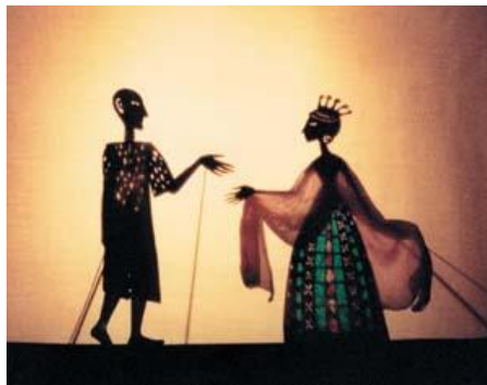
Ukázka stínové loutkohry