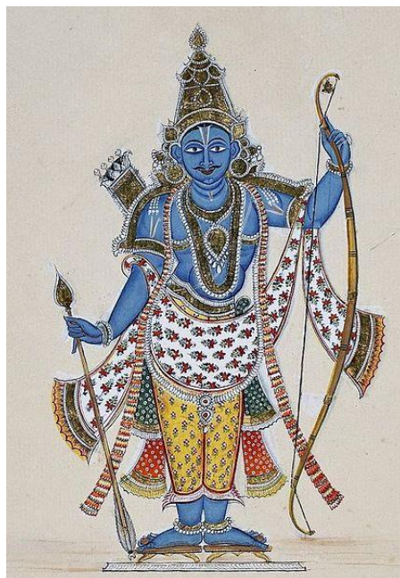
Ráma s lukem